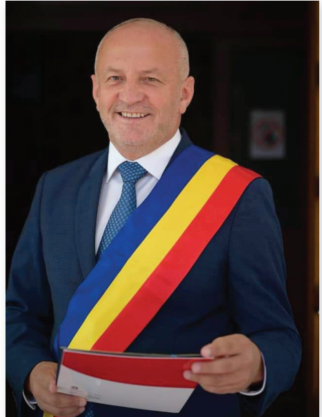
Ioan Doru Dăncuș Mayor of Baia Mare